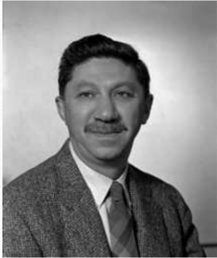
Абрахам Маслоу (ПСИХОЛОГ)

КРЕАТИВНОСТЬ – творческая направленность индивида, изначально свойственная всем (врождённая), но утрачиваемая многими людьми по причине определённых факторов: