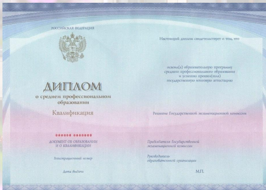
ДИПЛОМ О СРЕДНЕМ ПРОФЕССИОНАЛЬНОМ ОБРАЗОВАНИИ ГОСУДАРСТВЕННОГО ОБРАЗЦА