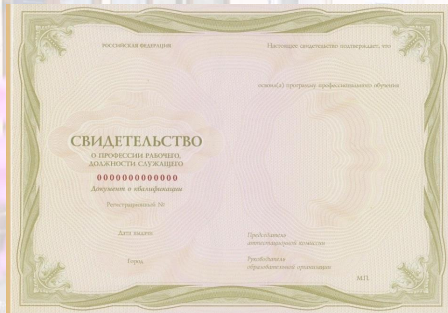
СВИДЕТЕЛЬСТВО О ПРОФЕССИОНАЛЬНОЙ ПОДГОТОВКИ